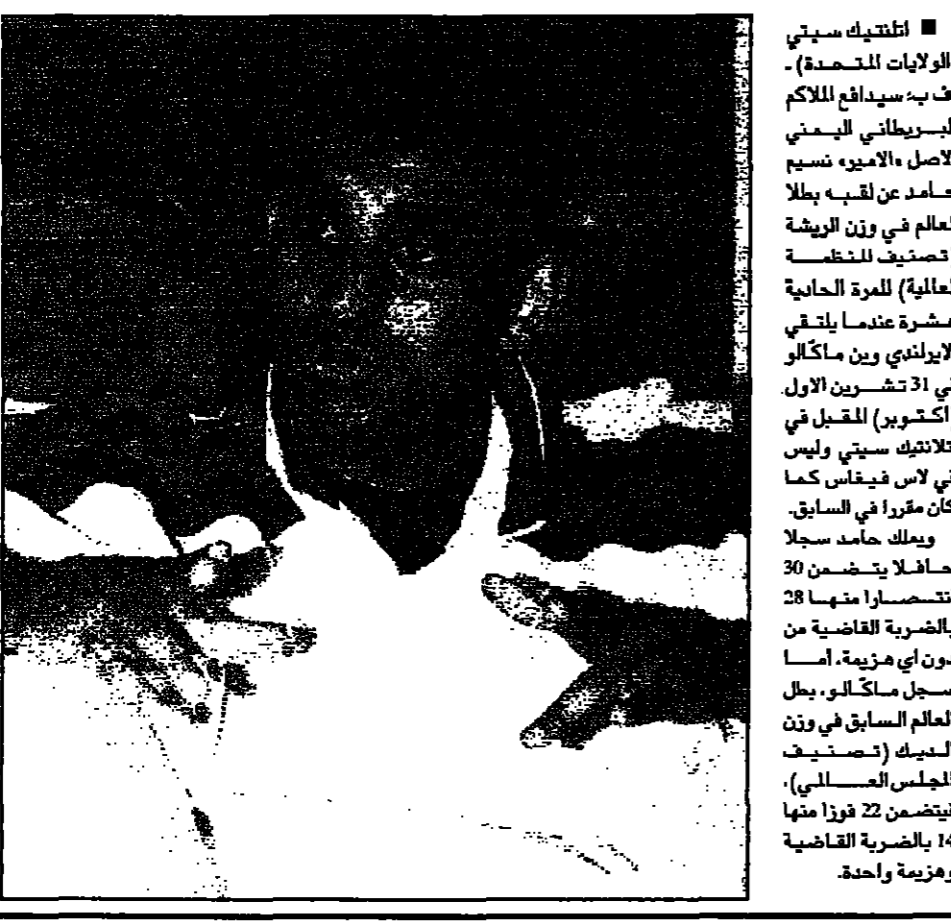
الولايات المتحدة) - ا ف ب: سيدافع الملاكم البيروطاني النسيم حامد عن لقبه بطلا للعالم في وزن الريشة (تصنيف للثقل - 57 كغ) للمرة الحادية عشرة عندما يلتقي الايرلندي وين ماكالو في 31 تشرين الاول (اكتوبر) المقبل في فيلادلفيا، بنسلفانيا. وكان ماكالو قد فاز في المباراة الأولى التي أقيمت في فيلادلفيا، بنسلفانيا.